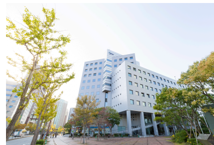
福岡SRPセンタービル